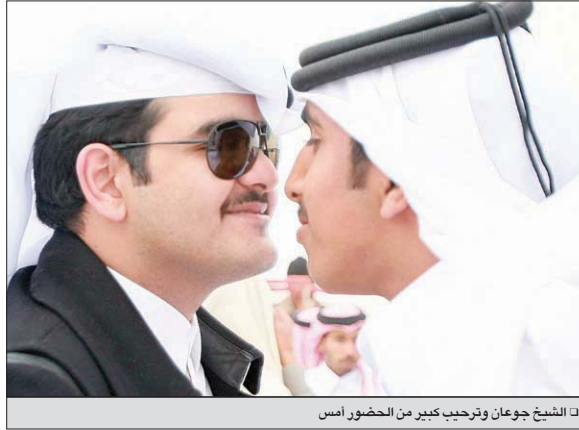
الشيخ جوعان وترحيب كبير من الحضور أمس